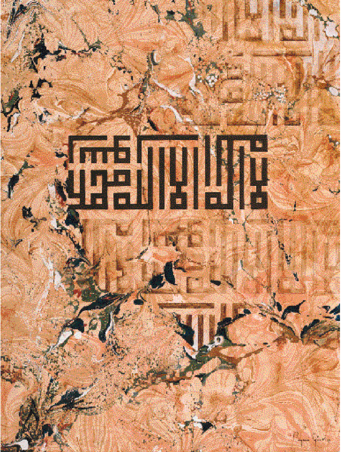
Albaraka Türk'ün 2000 yılı için hazırlanan Ebrû'lu hat takviminden bir örnek.